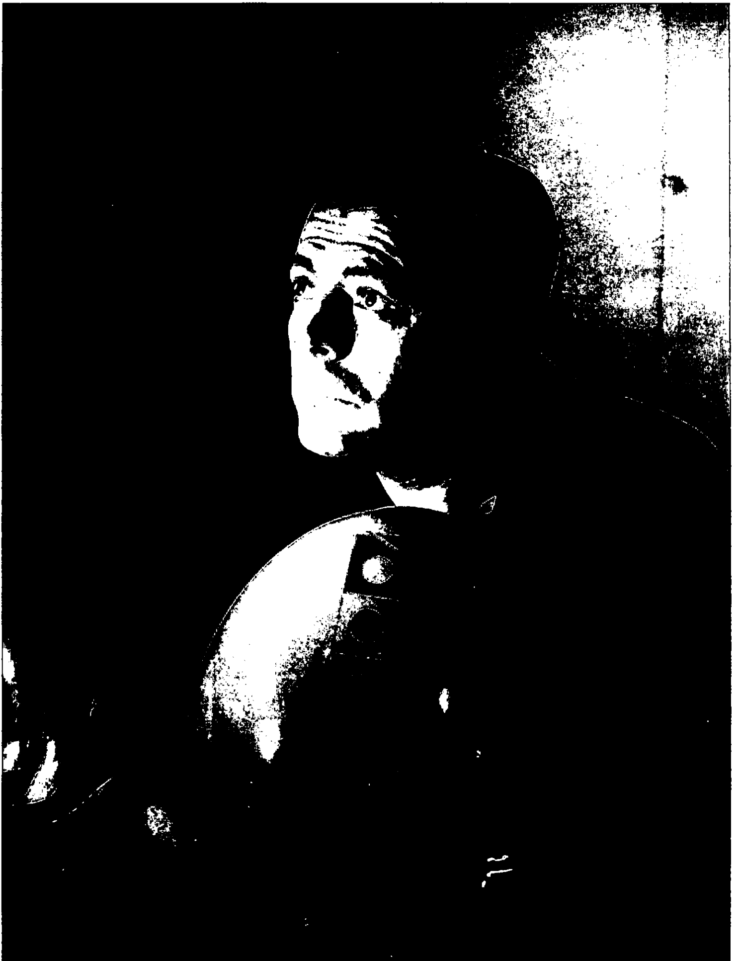
• BREAK-UP • (MARCELLO MASTROIANNI).